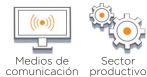
Medios de comunicación Sector productivo