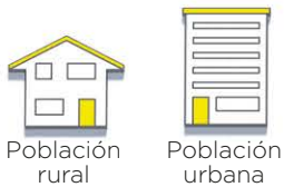
Población rural Población urbana

Entrevista telefónica con llamadas aleatorias a domicilios, respetando la proporcionalidad entre los diferentes grupos de población definidos.