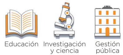
Educación Investigación y ciencia Gestión pública

Se seleccionan unas 20 personas de cada uno de estos cinco grupos de actores clave en la ciencia navarra: