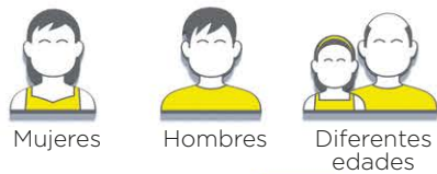
Mujeres Hombres Diferentes edades